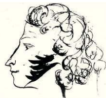
В молодости Россомаха был склонен к поэзии

Куда чаще вспоминаю про Леонида Леонова, второму исполнилось 95. Именно так оцениваю ближайший опасный рубеж.