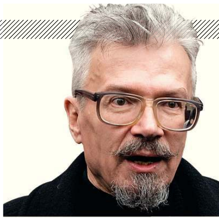
Эдуард Лимонов, автор концепции и организатор «Стратегии-31» — акций протеста на Триумфальной площади в Москве в защиту 31-й статьи Конституции РФ